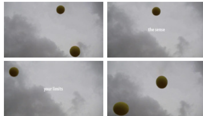
Afbeelding 7, Travelling Concepts in the Humanities, Library of Eina

De biografische scholingsweg A21 leert ons te komen tot een positieve omgang met vrijheid, de opgave van de creatieve mens in de 21e eeuw. Het is een 'in the end' ethische opgave die samenvalt met een proces waar goedheid, waarheid en schoonheid samenkomen. A21 wordt daarmee een plek waar gewerkt kan worden aan een Future Planet-design.