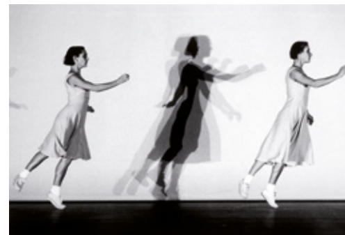
Afbeelding 1, Fase van Anne Teresa De Keersmaeker

Dit is A21, zoals die na het doen van wat opgravingen ook terug te vinden is bij ArtEZ hogeschool voor de kunsten. Naast ambacht en theorie is hier altijd veel aandacht besteed aan de mens. Je zou zelfs kunnen beweren dat de door mij geschetste onderwijsopvatting al verdukt aanwezig is bij ArtEZ en slechts een expliciete identificatie behoeft. Niet voor niets hebben wandeling teachers als Daan Roosegaarde, Iris van Herpen, Mark Manders, Viktor & Rolf en Lidewij Edelkoort hier hun sporen liggen.