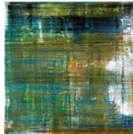
Afbeelding 4, Cage Series van Gerhard Richter

Sculpturing the self in de masterfase is een scholingsweg die gericht is op het openen van het denken. De student treedt in contact met een eindeloos landschap, een planetair stelsel met allerlei complexe relaties, dat zijn weerga niet kent. In deze derde fase van mastering creativity - het didactische equivalent van art based learning - ontwikkelt hij als een filosoof een eigen innerlijke stem. Het creatief denken krijgt vorm, door zich over te geven aan mogelijke werelden waarin de werkelijkheid, klein en groot, zich openbaart als een oneindig gecompliceerd proces. Natuurwetenschap (kwantummechanica), sociale wetenschap (psycho-analyse) en geesteswetenschap (narratologie) vervlechten. De student wordt een Tarkovsky. Hij denkt buiten de grenzen van het zichtbare.