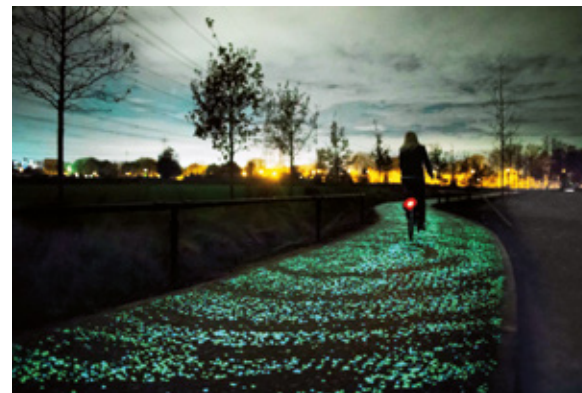
Afbeelding 6, Van Gogh-Roosegaarde Bicycle Path, Daan Roosegaarde/ Heijmans

In het sectorplan kunstonderwijs met de titel Focus op Toptalent (2011) staat dat de doelstelling van kunstonderwijsinstellingen moet verschuiven van kwantitatief naar kwalitatief, dat masters en promoveren topprioriteit moet krijgen. Ik heb getracht duidelijk te maken hoe dit streven zijn rechtvaardiging kan vinden in een goed begrip van wat hoger onderwijs hoort te zijn. Niet het behalen van een papiertje maar het doorlopen van een scholingsweg.