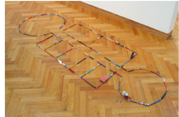
Afbeelding 5, First Floor Plan from Self-Portrait as a Building van Mark Manders

Het proces van mastering creativity en sculpturing the self komt bij de l'uomo creativo tot een (voorlopig) einde. De creatieve wetenschap metamorfoseert in een creatieve daad. Iedere leermeester die zijn eigen school maakt, vertelt een eigen verhaal. Hij opent een wereld voor de ander: het publiek, de student, de collega. Het meditatieve genius van Plato valt samen met het wetenschappelijke genius van Aristoteles. De eerste fase van het leerproces was die van de menswetenschap (Plato). De middenstroom was het gebied van de vakdisciplines (Aristoteles). De derde stroom van het leerproces is die van de samenleving. De wetenschap van Plato, Aristoteles, Emerson, Nietzsche, Benjamin, Deleuze en de kunst van Da Vinci, Michelangelo, Pico, Kafka, Tarkovsky, Beuys vallen samen. De leermeester betreedt de wereld van de mens in opstand (Camus, 1951).